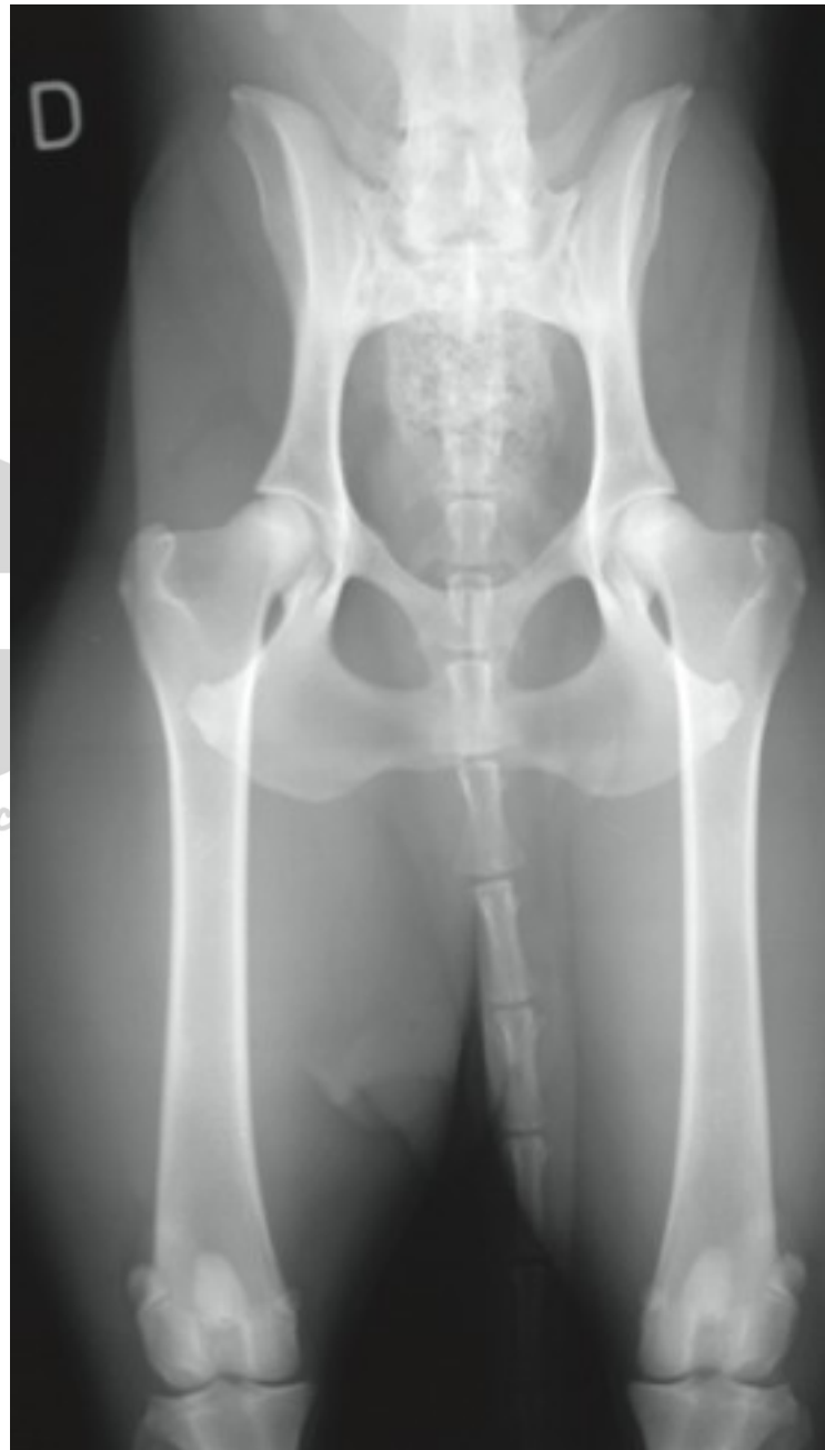
Imagen 2: Posición ventro dorsal con las extremidades dobladas – Para apelaciones.

Imagen 1: Posición ventro dorsal con las extremidades estiradas – Para primer diagnóstico.