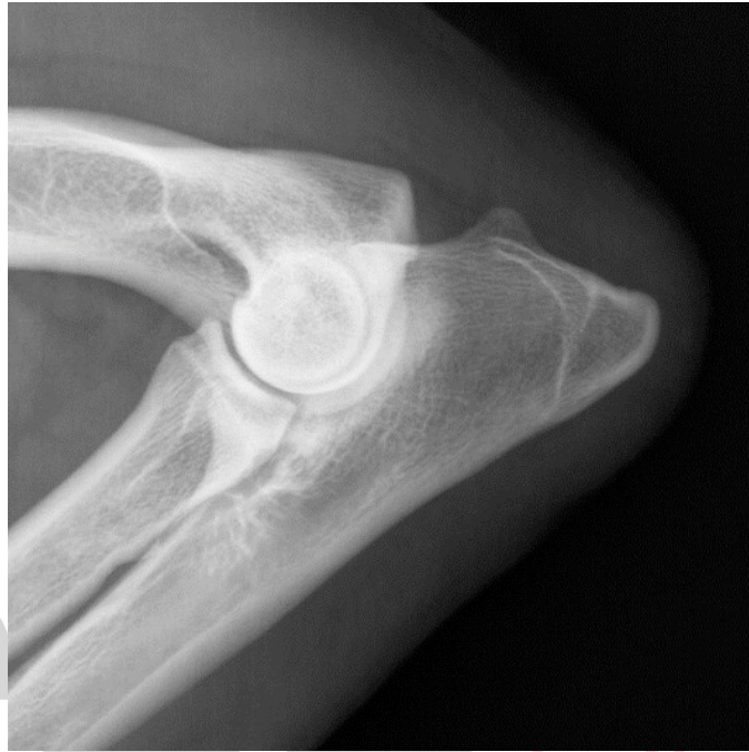
Imagen 4: posición medio-lateral extendida 120° – Para apelaciones.

Imagen 3: Posición medio-lateral 45° – Para primer diagnóstico y para apelaciones